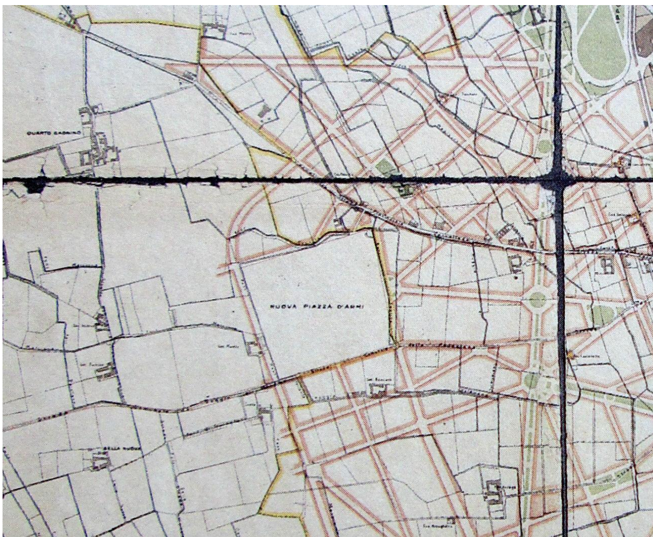
Figura 3 – Civiche Raccolte d'Arte "Bertarelli". Castello Sforzesco. Milano. Pianta di Milano con l'indicazione del Piano Generale Regolatore del 1911. Per la prima volta compare su una mappa l'area della "Nuova Piazza d'Armi".

(delibera del Comune di Baggio del 10 giugno 1909 n.d.a.) 22 la nuova piazza d'Armi di Milano e adiacenze deve essere aggregata al Comune di Milano; le corrispondenti strade pertanto devono formare parte del piano di ampliamento di Milano. 23 [...] Il piano contempla anche la rettifica e l'allargamento fino a m. 20 della attuale strada per Baggio, allo scopo di provvedere alla richiesta dell'autorità militare di un comodo accesso per le truppe alla nuova Piazza d'Armi situata a nord di detta strada 24 ». È questo il più antico documento in cui si definisce questa porzione di territorio: Piazza d'Armi.